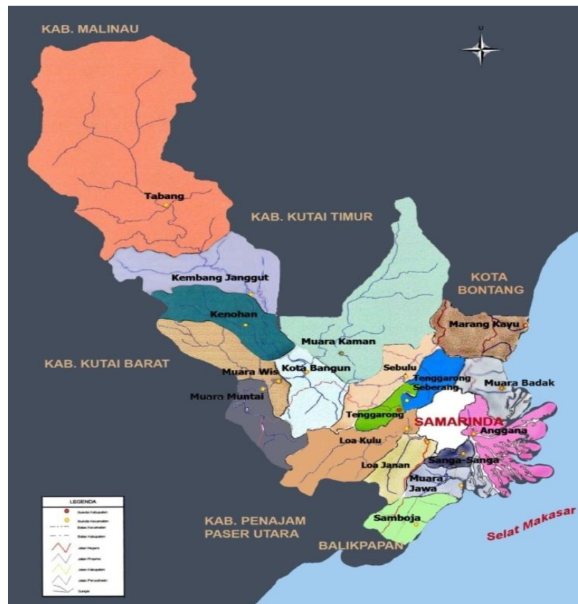
Gambar 1.1. Peta Wilayah Administratif Kecamatan Tenggarong

Dengan luas wilayah desa/ kelurahan di kecamatan tenggarong sebagai berikut :