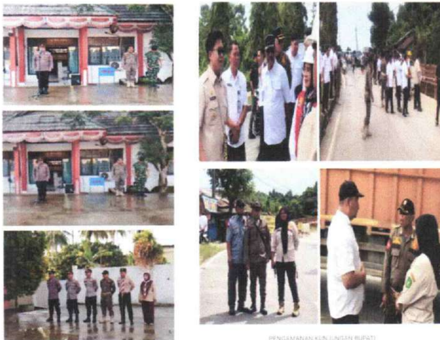
PENGAMATAN KLIN LUNGAN BUPATI