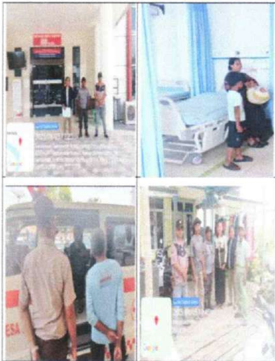
DOKUMENTASI EVAKUASI DAN PENGANTARAN ODGJ KE RSUD ATMA HUSADA MAHAKAM SAMARINDA SELASA, 05 AGUSTUS 2025