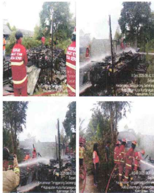
DOKUMENTASI BENCANA KEBAKARAN DESA SEPARI Selasa, 09 Desember 2025